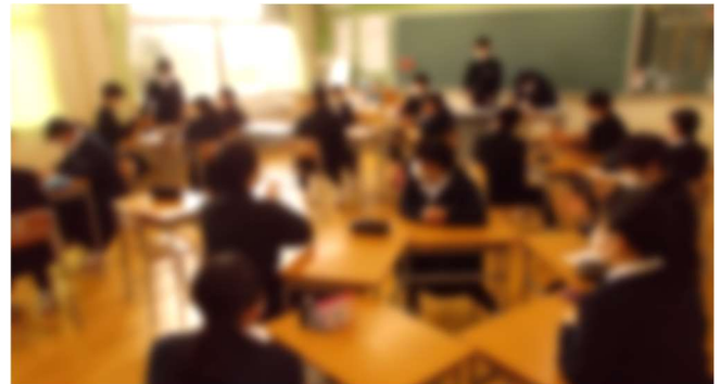
2月26日（金）1限 学活（修学旅行の決まり学級討議の様子） 左：2組 右：1組