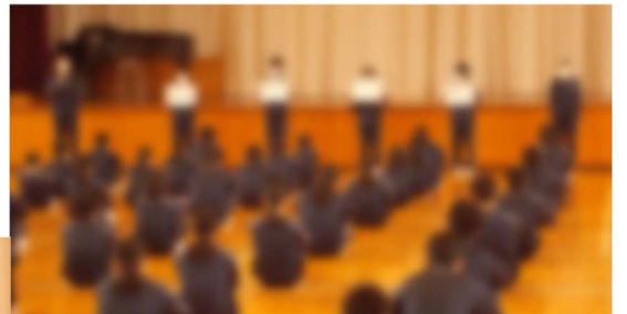
3月18日(木) 生徒朝会の様子